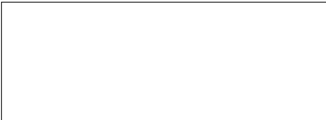
Kopfteilstreifen Höhe 15 cm x Länge 58 cm plus Nahtzugabe